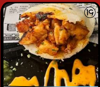
TAPAS Y AREPAS C/ Acibelas 5