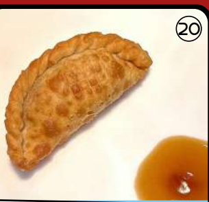
LA BAMBALINA Plaza Martí y Monsó 2

Arepa de maíz rellena de carne de pollo y mermelada de tomate, con tres salsas para degustar a gusto de cada uno