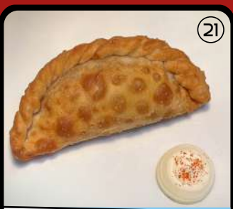
LA BAMBALINA Plaza Martí y Monsó 2